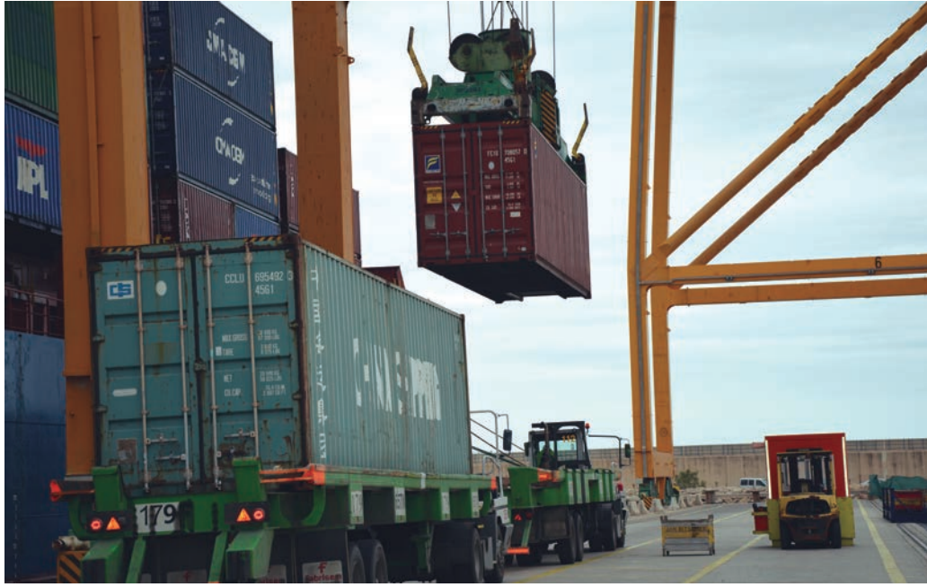
La reunión de esta tarde entre la parte social y empresarial del CPEV determinará los siguientes pasos a seguir.

El conflicto entre la parte social y empresarial en el Centro Portuario de Empleo de Valencia (CPEV) surge tras la decisión de las empresas de activar un nuevo sistema de gestión en