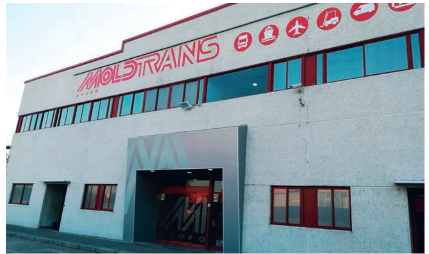
La certificación OEA es el resultado del trabajo realizado en los últimos meses por la división de Aduanas de Grupo Moldtrains.

Los puertos españoles de interés general tienen por delante la complicada tarea de seguir siendo competitivos en un entorno que nos va sacando distancia en muchos aspectos, como es el caso de la digitalización o la automatización. Podemos seguir mirándonos al ombligo contemplando el camino recorrido, o podemos alzar la vista para comprobar que el trecho que nos queda por recorrer es largo, duro y complejo.