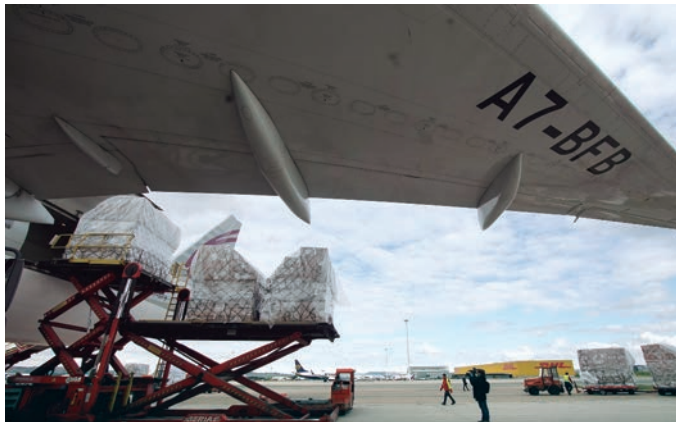
El Ebitda de Aena se ha situado en 516 millones hasta septiembre.

No obstante, a pesar de esta reactivación, señala la compañía, Aena continúa con su política de ahorro de costes, que le