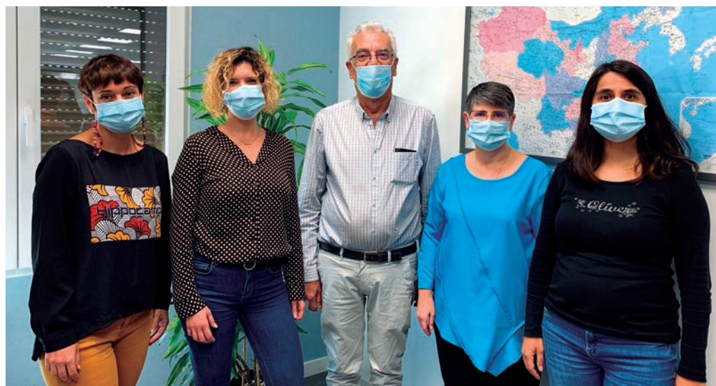
En el imagen, parte del equipo de la División de Aduanas de MPG Group.

En la actualidad, la División de Aduanas de MPG Group está in-