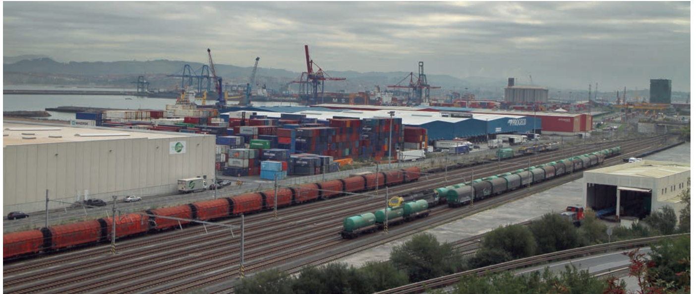
Imagen del Puerto de Bilbao en el día de ayer, en el que se cumplían 20 días desde que el pasado 9 de octubre comenzara la huelga de la estiba.

Tanto en la primera, en la tarde del martes, como en la de ayer por la mañana, según pudo saber Diario del Puerto las cuestiones tratadas por las partes se referían a las condiciones nece-