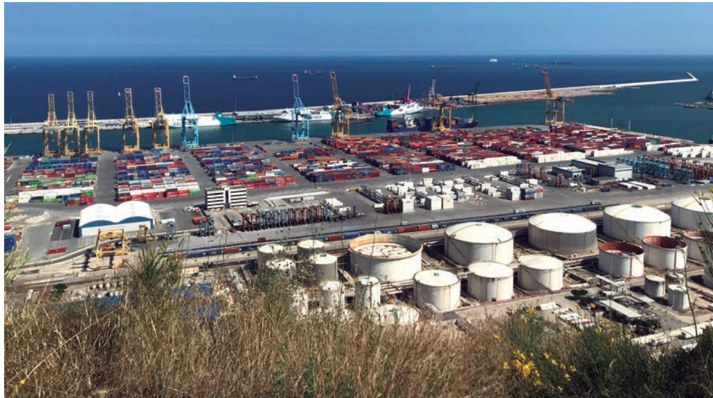
La concesión gestionada por APM Terminals en el Puerto de Barcelona desde 1992 es de una superficie total de 80 hectáreas.

La solicitud de ampliación del plazo concesional se enmarca en la disposición transitoria décima con la que se reformó la Ley de Puertos en materia de amplia-