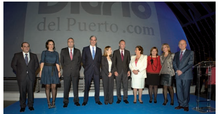
XX Aniversario de Grupo Diario.