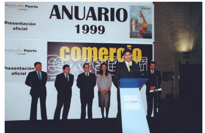
Celebración del V Aniversario de Grupo Diario.

Lo más importante de los 27 años de Grupo Diario sigue siendo el futuro. En breve se empezará a concretar una renovación total de productos, que incluirá ofertas de comunicación logística totalmente nuevas.