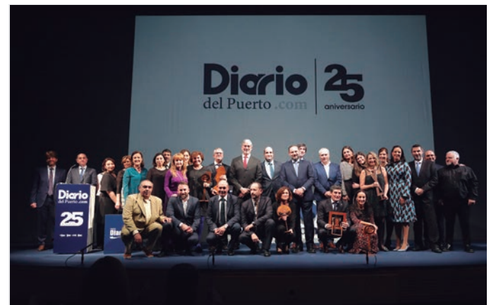
Celebración del 25º Aniversario de Grupo Diario.